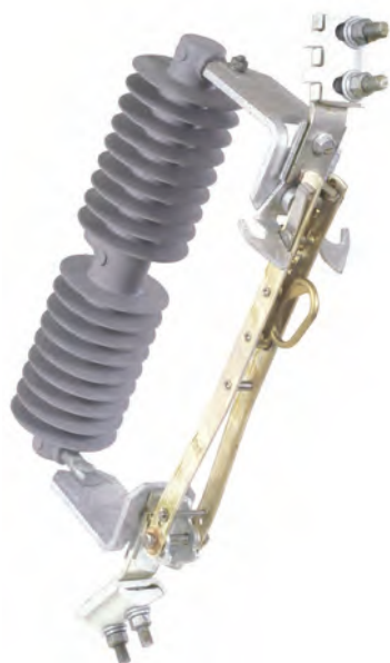
Cuchilla Monopolar para montaje en poste